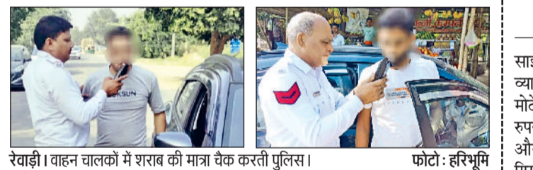
रेवाड़ी। वाहन चालकों में शराब की मात्रा चेक करती पुलिस।