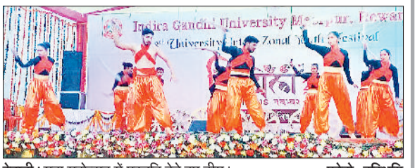
रेवाड़ी। युवा महोत्सव में प्रस्तुति देते हुए टीम।