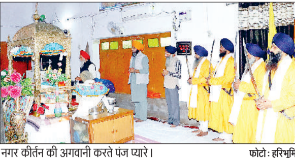
नगर कीर्तन की अगुवानी करते पंज प्यारों।

ने पुष्प वर्षा कर यात्रा का जोरदार अभिनंदन किया। रविवार व सोमवार को शहर में धार्मिक माहौल बना रहा और वाहे गुरु जी का खालसा, वाहे गुरु जी की फतेह के जयकारों से नगर गुंजायमान रहा। पंज प्यारों की अगुवाई में यात्रा मेहता चौक से शुरू होकर