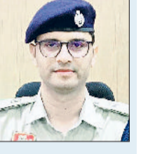
हेमंद्र कुमार मीणा

इस मौके पर एसपी मीणा ने बाइक राइडर्स व ईआरवी पर तैनात पुलिस जवानों को अपने-अपने इलाकों में ज्यादा से ज्यादा गश्त व पेट्रोलिंग करने के निर्देश दिए ताकि असामाजिक तत्वों पर लगाम कसी जा सके। एसपी ने कहा कि सभी अपने घरों के बैकों व एटीएम पर लगातार गश्त करें। स्कूल व कॉलेज की छुट्टी के समय जाम की स्थिति न पैदा होने दें। अपने-अपने घरों में पडने वाले स्कूल व कॉलेज की छुट्टी होने के समय शरारती तत्वों पर नजर रखें। अगर कोई समस्या आती हो तो अपने उच्च अधिकारियों को सूचित करें। एसपी ने कहा कि सभी डायल 112 टीम व राइडर्स आपस में तालमेल बनाए रखें ताकि अपराध पर अंकुश लगाया जा सके। शहर में ट्रैफिक पर विशेष ध्यान देकर जाम की स्थिति पैदा न होने दें। वाहन चलाते समय मोबाइल फोन का प्रयोग करने वाले तथा बुलेट मोटरसाइकिल पर पटाखे बजाने वालों पर अधिक से अधिक कार्रवाई करें।