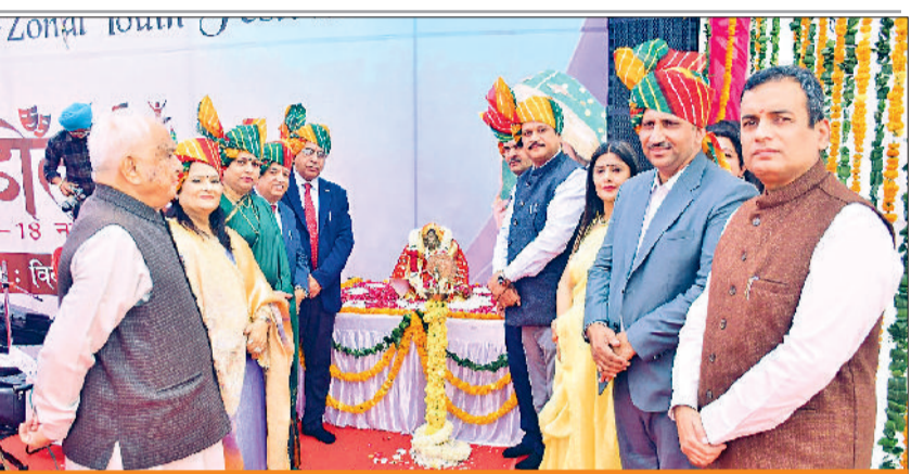
आईजीयू में युवा महोत्सव का शुभारंभ करते अतिथि