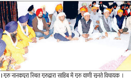
नारनौल। गुरु नानकपुरा स्थित गुरुद्वारा साहिब में गुरु वाणी सुनते विधायक।

ने पुष्प वर्षा कर यात्रा का जोरदार अभिनंदन किया। रविवार व सोमवार को शहर में धार्मिक माहौल बना रहा और वाहे गुरु जी का खालसा, वाहे गुरु जी की फतेह के जयकारों से नगर गुंजायमान रहा। पंज प्यारों की अगुवाई में यात्रा मेहता चौक से शुरू होकर