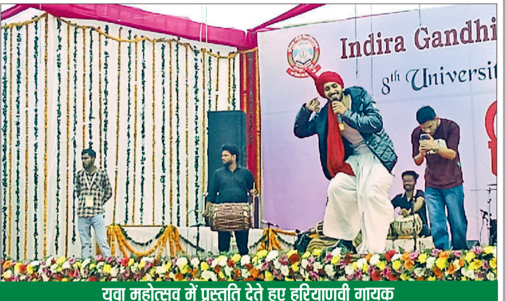
युवा महोत्सव में प्रस्तुति देते हुए हरियाणवी गायक