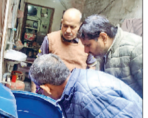
रेवाड़ी। पशु खेल में लार्वा मिलने पर पानी खाली करते स्वास्थ्यकर्मी, पानी के ड्रम में लार्वा की जांच करते स्वास्थ्यकर्मी।

विभाग की टीमों अब तक घरों में लार्वा मिलने पर 3837 लोगों को नोटिस भी दे चुकी है। एमपीएचडब्ल्यू व ब्रीडिंग चेकर टीम अब तक सोसं रिडेक्शन एक्टिविटी के तहत 2120867 घरों में लार्वा की जांच कर चुकी है। शहर में मिल चुके 127 डेगू मरीज मलेरिया हेल्थ इस्पेक्टर हरिप्रकाश ने बताया कि सीजन में अभी तक डेगू के 292 केस व मलेरिया के 14 केस मिल चुके हैं। जिले में अभी तक शहर में