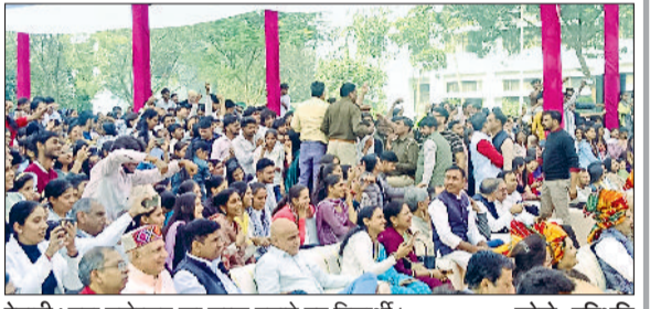
रेवाड़ी। युवा महोत्सव का लुफ उठाते हुए विद्यार्थी।