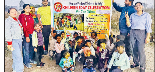
रेवाड़ी। बच्चों के साथ खुशी बाँटते हुए संस्था के सदस्य।