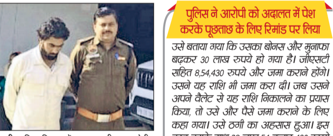
रेवाड़ी। पुलिस गिरफ्तार में साइबर ठगी का आरोपी।