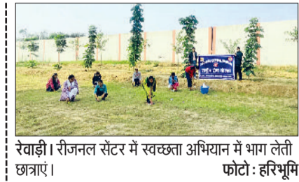
रेवाड़ी। रीजनल सेंटर में स्वच्छता अभियान में भाग लेती छात्राएं।