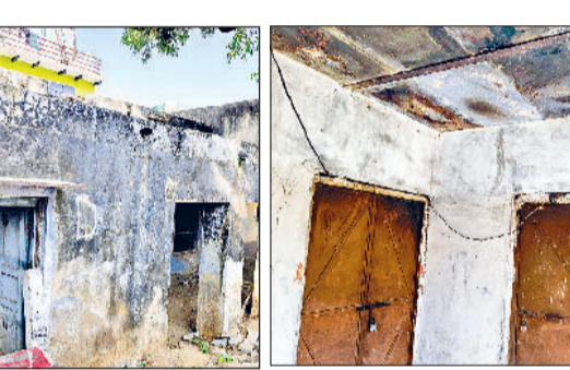
मंडी अटेली। खामपुरा में खंडहर अवस्था में अनुसूचित जाति चौपाल। व पंचायत घर में लटकता प्लास्टर

खंड सिहमा के गांव खामपुरा में बना पंचायत घर देखरेख के अभाव में खंडहर हो गया है। स्थिति यह है कि यहां बैठक आदि होना तो दूर, हर व्यक्ति गंदगी के चलते यहां आने से बचता है। भवन भी पूरी तरह से जर्जर हो चुका है। ग्राम पंचायत के दो बार प्रस्ताव देने पर भी जीर्णोद्धार के लिए पहल नहीं हो रही है। यह पंचायत घर गांव की समस्याओं के निवारण के लिए होने वाली पंचायत के उद्देश्य से बना था, लेकिन देखरेख के अभाव में अब इसका भवन जर्जर हालत में पहुंच चुका है।