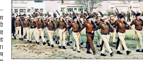
रेवाड़ी। पुलिस लाइन में परेड करते हुए पुलिस के जवान तथा माँकड्रिल में अभ्यास करते हुए पुलिसकर्मी।