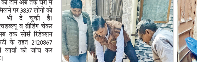
रेवाड़ी। पशु खेल में लार्वा मिलने पर पानी खाली करते स्वास्थ्यकर्मी, पानी के ड्रम में लार्वा की जांच करते स्वास्थ्यकर्मी।

दिन का तापमान सामान्य चलने के कारण डेगू का मच्छर बार-बार एक्टिव हो रहा है। हालांकि डेगू के मरीजों का आंकड़ा थमने की ओर अग्रसर है। जिले में सोमवार को चार दिन बाद डेगू के 2 पॉजिटिव मरीज और मिलने से सीजन में आंकड़ा 292 पर पहुंच गया है। नवंबर माह में अब तक डेगू के 15 मरीज मिल चुके हैं। अभी तक 222 डेगू के मरीजों की पुष्टि प्राइवेट लैबों व 70 डेगू के मामलों की पुष्टि सरकारी लैब से की गई है। स्वास्थ्य