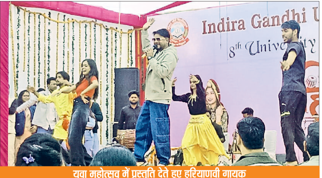
युवा महोत्सव में प्रस्तुति देते हुए हरियाणवी गायक