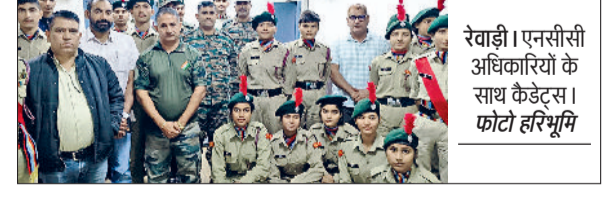
रेवाड़ी। एनसीसी अधिकारियों के साथ कैडेट्स की